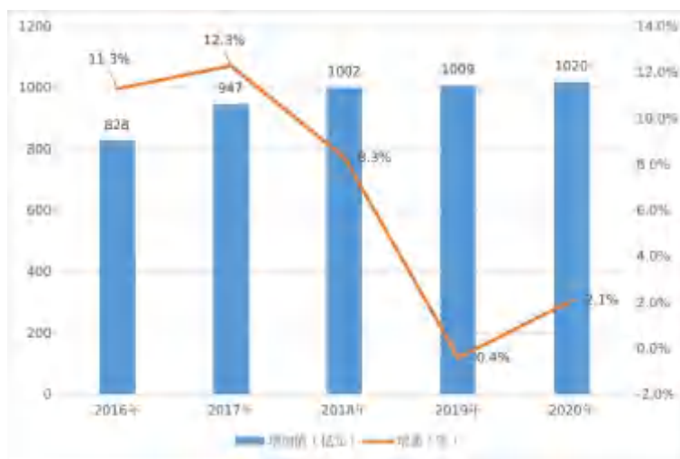
图 1 “十三五”制造业增加值发展情况

2020 年全市制造业增加值 1020 亿元，占全市工业增加值的 93.4%，增长 2.1%；“十三五”期间，年均增长 6.6%。